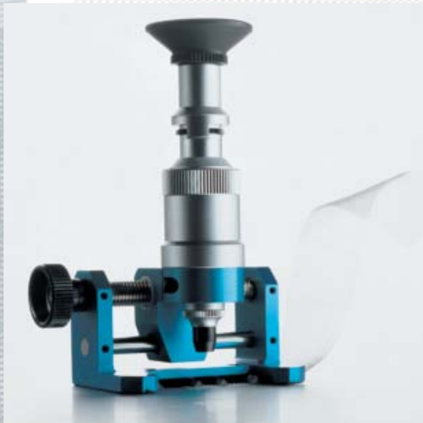
BOPP Mesh Counter